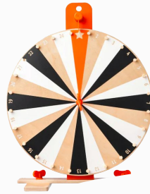
2 Draaiend rad