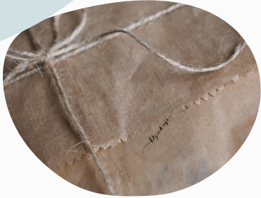
1 Guess the package